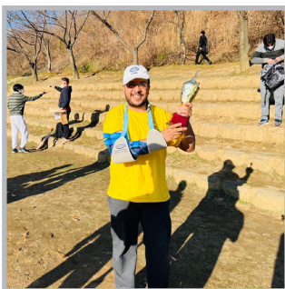
인터코리아 크리켓 대회 챔피언 카이스 이슬람 커뮤니티 리더 라마단금식행사 박진 외교부 장관과 함께