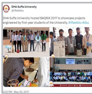
DHA Suffa에서 BAQRIX 그룹을 이끄는 강사 및 멘토로 활동

다시 한번 강조하지만 우리의 과거 실패 경험은 개인적인 성장과 회복력을 키우기 위한 소중한 교훈이 될 것이다. 현재는 그런 과거의 교훈을 학습하고 자기 계발을 이어 나가기 위한 기회이다. 여정을 나아감에 있어 미래에 우리를 기다리고 있을 크고 작은 업적을 잊지 말아야 한다. 자신을 믿고, 긍정적으로 생각하고, 스스로가 빛날 수 있도록 하여 주변 사람들에게도 영감이 될 수 있도록 하자.